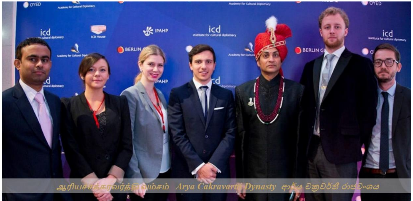
ஆரியசக்கரவர்த்தி வம்சம் Arya Cakravarti Dynasty ආර්ය චක්‍රවර්ති රාජවංශය

ඔබලාගේ සිංහල බෞද්ධ_රාජ්‍ය ශක්තිය බිඳින්නේ LTTE එක, NWO සහ වනිකානුව එක්ක. එයට බොහෝ බෞද්ධ භික්ෂුන් වහන්සේලා පවා රවට්ට ගන්න NGO මගින්. LTTE එකේ ඉහලම ඉන්න ෆාදර් පෝසල් එමානුවෙල් බ්‍රදර් වාර්ල්ස් හරහා ඔබලාව සංගීතයෙන් මත්මත් කෙරෙව්වා. ඔබලාව රවට්ටු තරම! ප්‍රහාකරන් හරි, සිංහලයට ඉතා ඉක්මනින් අතීතය අමතක වෙන බව කිව්වා.